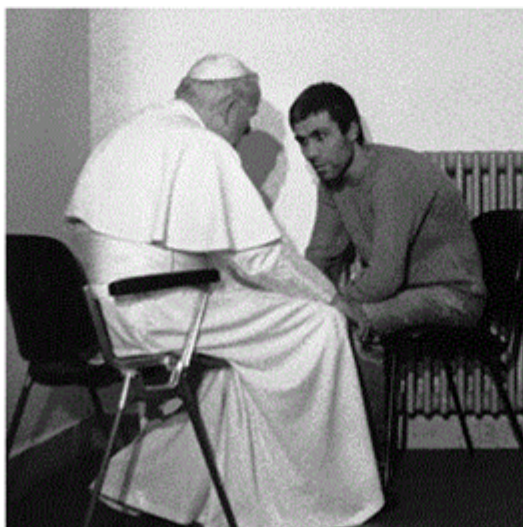
Papa Giovanni Paolo II incontra il suo attentatore Ali Agca

N.I.P. - 16° ANNO: Anno della misericordia